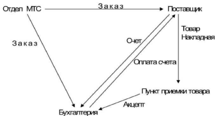
Рис. 1. Существующая организация процессов закупок в компании Ford

В результате проведения бизнес-реинжиниринга было принято решение, что должна быть организована распределенная база данных, в которую помещается информация заказа (рис.2).