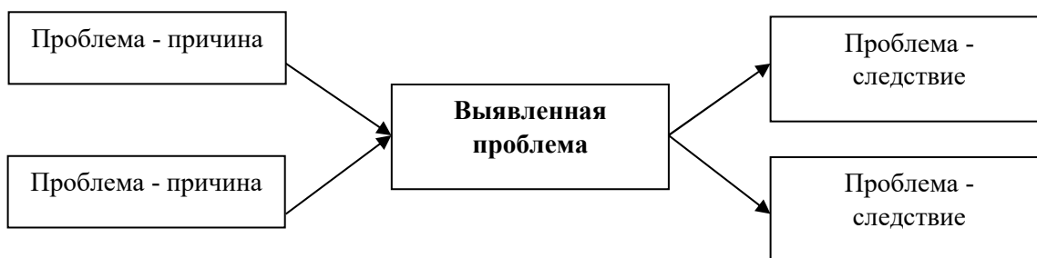
1. Схема причинно-следственного анализа [5]

Пример оформления представлен на рис. 1. Иное оформление рисунков не допускается