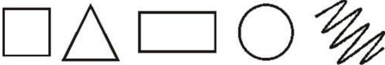
Рис. 2. Психометрический тест

Если Вы испытываете сильное затруднение, выберите из фигур ту, которая первой привлекла Вас, нравится больше остальных. Запишите под ее изображением цифру 1. Теперь проранжируйте оставшиеся четыре фигуры в порядке вашего предпочтения и запишите цифры под ними.