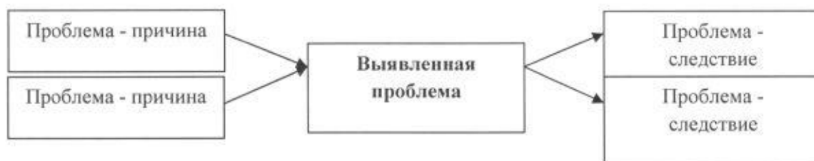
Рис. 1. Схема причинно-следственного анализа [5]

От текста рисунок отделяется пропуском строки. Данные в рисунке могут быть представлены шрифтом 10-11 пунктов и одинарным межстрочным интервалом.